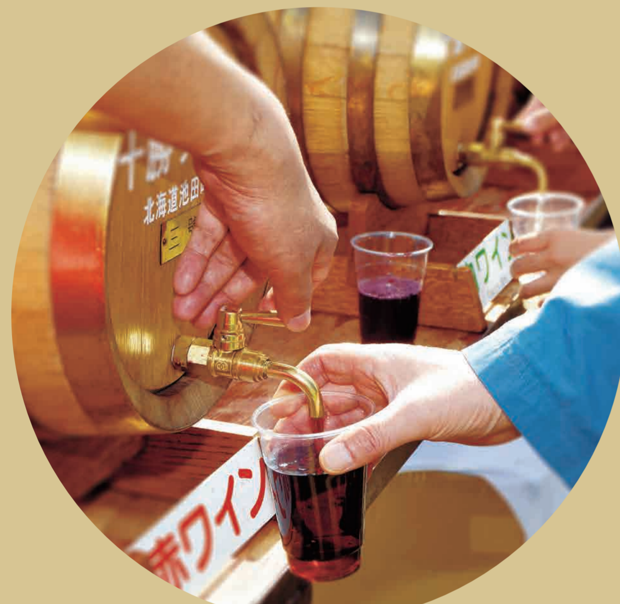
十勝ワイン 飲み放題

ワイン祭りでは、ホワエクのパフォーマンス、ワインやぶどうジュースの飲み放題、道産牛の炭火焼き食べ放題、“元祖牛の丸焼き”をお楽しみ頂けます